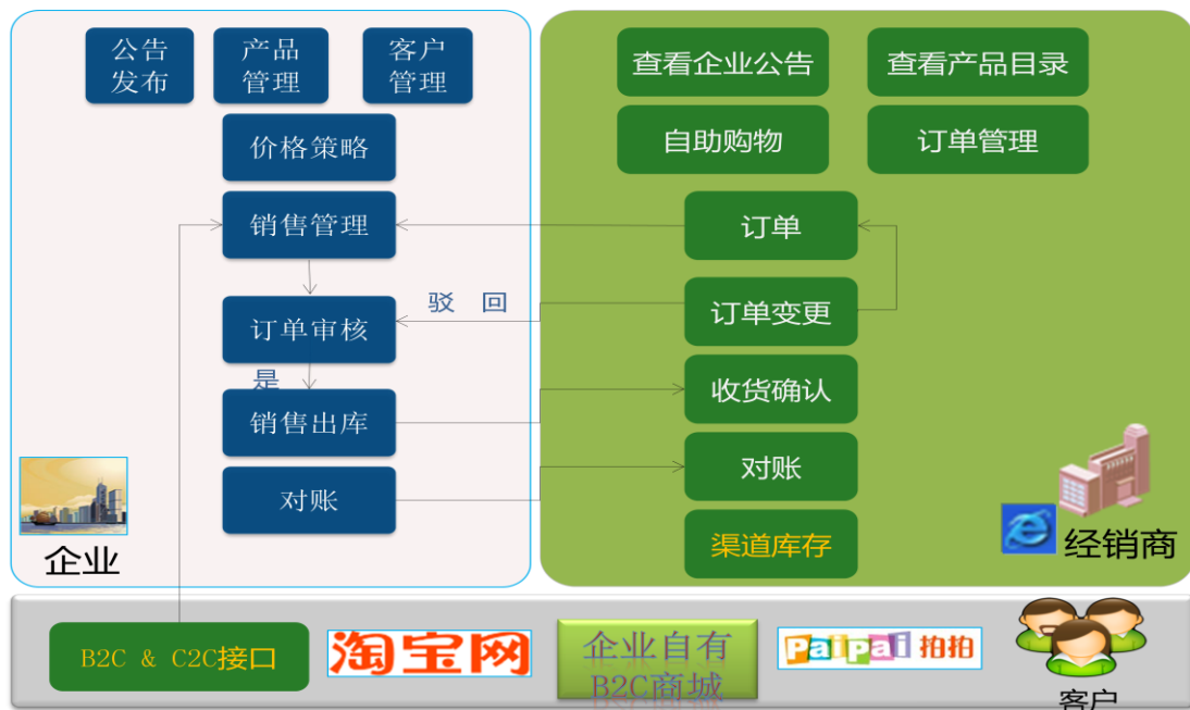
K/3 经销商管理解决方案业务流程图：

经销商协同解决方案适用于：链主型企业下游经销商、以及与企业长期合作的直销大客户较多，订单交付频繁，急需改善供销关系及建立电子商务平台的制造型企业或品牌产品区域总代等类型企业应用。